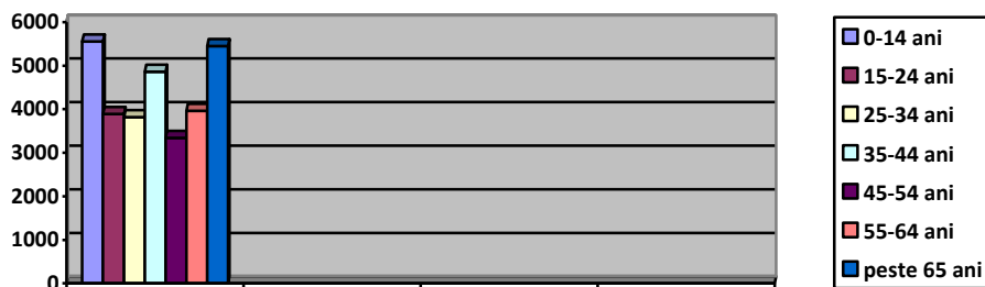
Fig.2 - Structura populatiei pe medii de varsta Sursa - www.recensamantromania.ro

Conform datelor prezentate mai sus, se observa o imbatranire a populatiei, lucru cauzat de migratia tinerilor din mediul rural catre mediul urban.