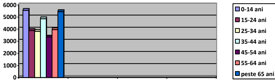
Fig.2 - Structura populatiei pe medii de varsta

Conform datelor prezentate mai sus, se observa o imbatranire a populatiei, lucru cauzat de migratia tinerilor din mediul rural catre mediul urban.